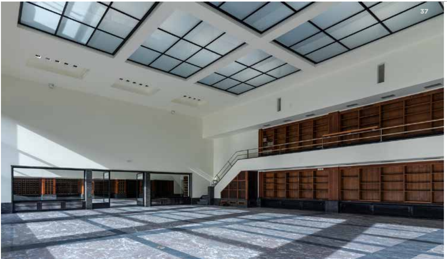
↑ Gerestaureerde universiteitsbibliotheek te Gent (ill. Artes)

Minister Zuhal Demir streeft naar 95.000 renovaties per jaar. In het kader van het Vlaamse relanceplan wordt daarvoor 422 miljoen euro uitgetrokken.