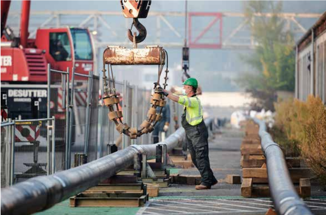
↑ Aanleg van een warmtenet in Mortsel (ill. Denys)

de plaats komt van het gas dat zorgde voor de stoom voor het reinigen en opwarmen van tanks en containers.