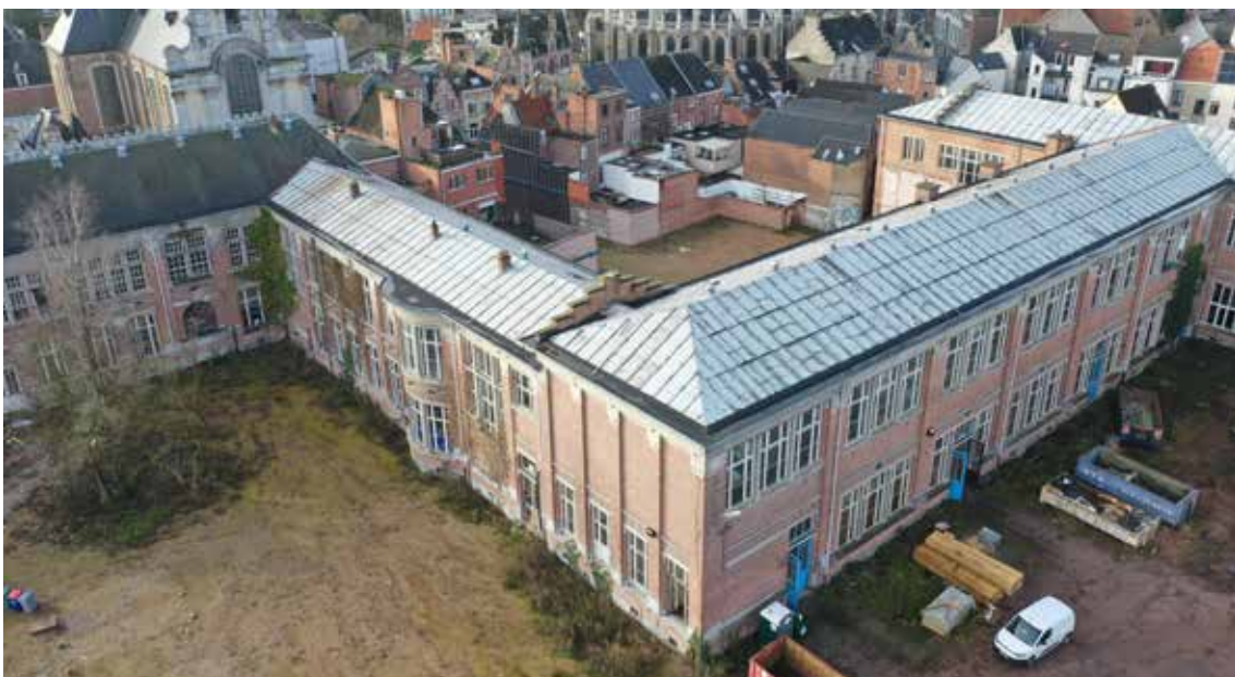
↓ Artes staat in voor de afbraak, ruwbouw, afwerking en omgeving voor de herbestemming van de Normaalschool te Lier tot gemengd stedelijk project (ill. Artes)

Voor verkeersveiligheid trekt minister Peeters 200 miljoen extra uit in het kader van het Vlaamse herstelplan. Daarvan zijn 50 miljoen euro