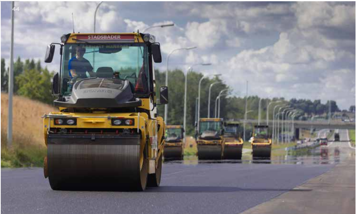
↑ Structureel onderhoud van het asfalt op de E17 en de R8 te Kortrijk (ill. Stadsbader)