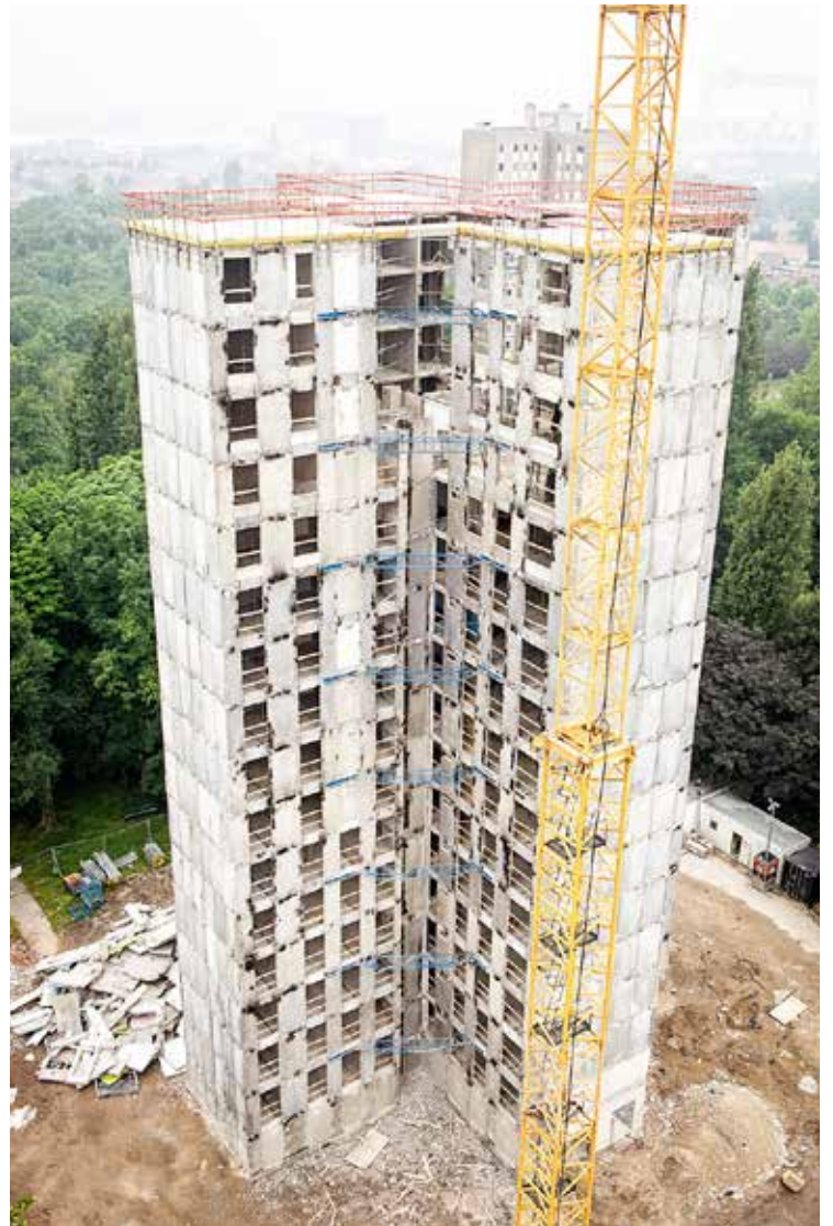
→ Ontmanteling van een woontoren in de wijk Kleine Heide te Hoboken (ill. VDS Vanderstraeten)

Vanuit zijn bevoegdheid als cultuurminister wil minister-president Jambon vanuit het Vlaamse herstelplan 100 miljoen extra in culturele infrastructuur investeren. De projecten worden in het herstelplan nominatim opgesomd. Tabel 6 geeft een overzicht van de betrokken projecten. Bijna al deze subsidies worden nog in 2021 vastgelegd.