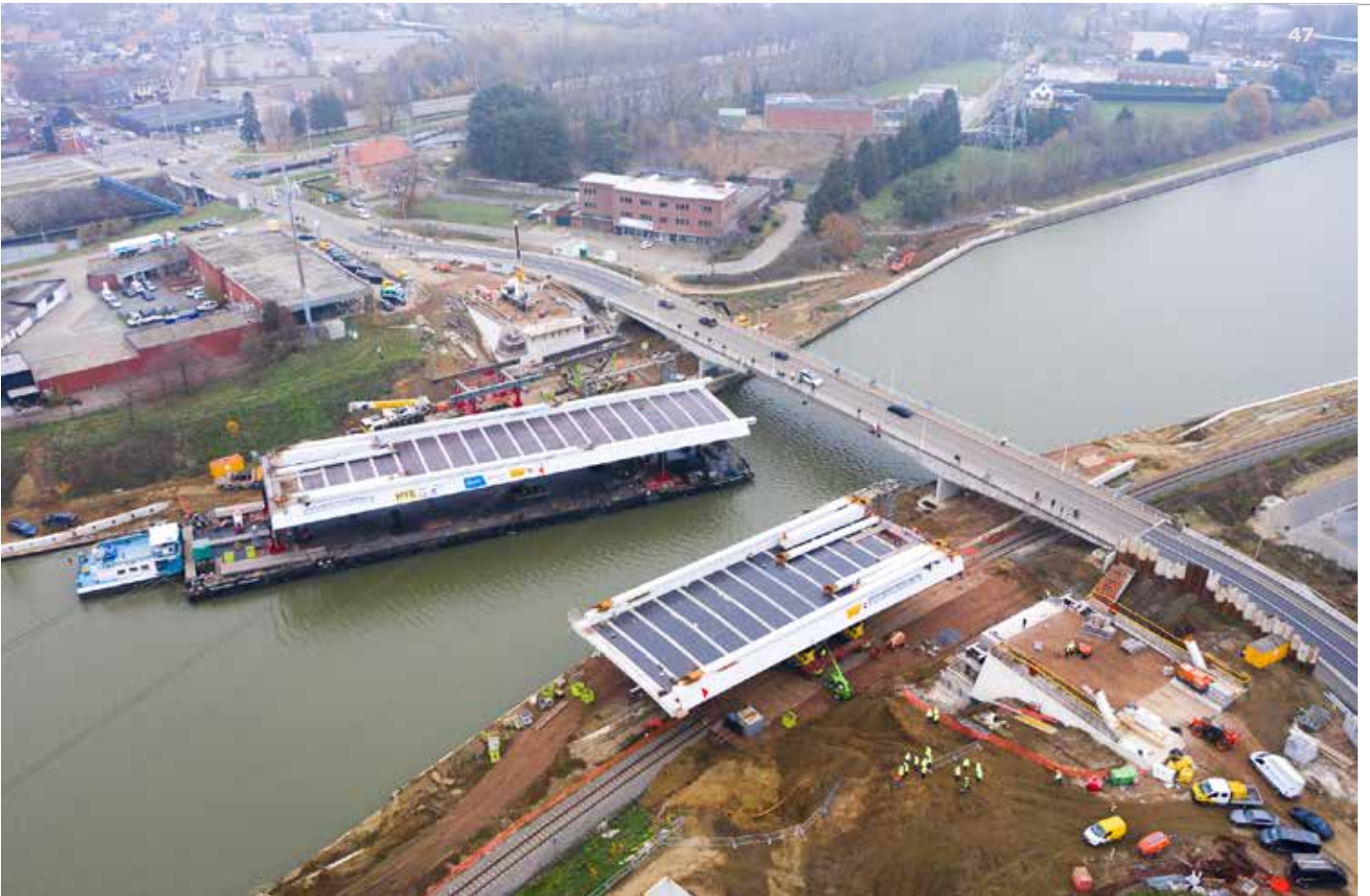
↑ Aanleg van een nieuwe brug over het Albertkanaal in Herentals (ill. Willemen)

pompen van water van het afwaartse naar het opwaartse kanaalpand. Daardoor moet minder water uit de Maas worden afgenomen. Maar als nog voldoende water beschikbaar is, kunnen de pompinstallaties in omgekeerde richting als waterkrachtcentrale dienstdoen. Tegelijk komen er pompinstallaties op de 4 sluisen van het kanaal naar Charleroi en 2 pompstations in de Durmevallei. Die moeten in de sigmagebieden Groot en Klein Broek wateroverlast tegengaan in de winter en verdroging in de zomer.