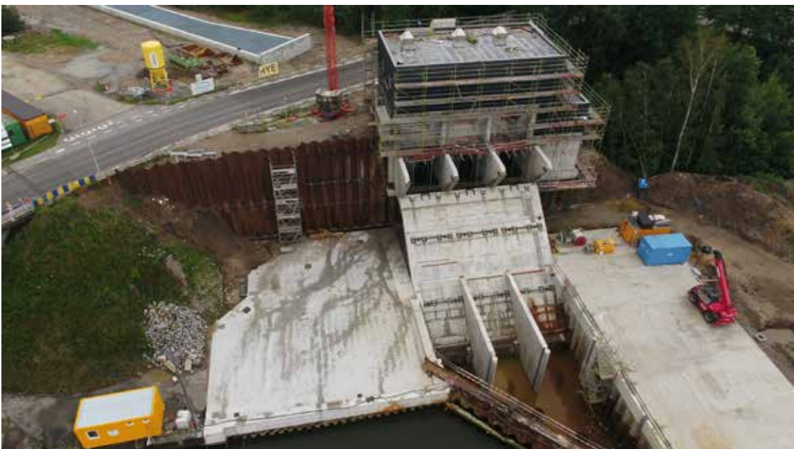
↓ Pompinstallatie met waterkrachtcentrale op het sluiscomplex te Diepenbeek (ill. De Waterweg)

Van de 244.000 ha natte natuur die nog in de jaren 50 bestond, blijft nu maar 68.000 ha over. Via een investeringsprogramma van 100 miljoen euro wil minister Demir de natte natuur in wetlands en valleigebieden herstellen en versterken. Het agentschap Natuur en Bos krijgt 70 miljoen voor aankopen en inrichtingswerken. Daarnaast zal de minister in 2021 en 2022 oproepen naar derden lanceren voor specifieke aankoop- en investeringssubsidies op dit vlak voor 30 miljoen euro.