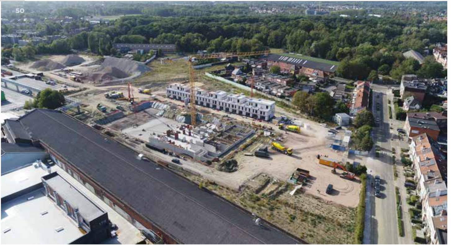
↑ Realisatie van de woonwijk Minerve op de voormalige Agfa Gevaert site in Edegem (ill. VDS Vanderstraeten)

voor de aanpak van de intussen dynamische lijst van gevaarlijke punten bestemd. Reeds in 2021 vinden al kleinere ingrepen op gevaarlijke kruispunten plaats. Op een deel van die punten volstaan ingrepen zoals een aangepaste lichtregeling of markering. Op een ander deel gaat het maar om een tussentijdse oplossing in afwachting van uitgebreidere maatregelen zoals een grondige herinrichting van het kruispunt.