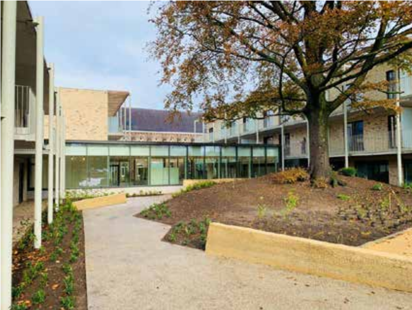
← In 2020 opgeleverd woonzorgcentrum Angela Hof in Diepenbeek (ill. Dethier)

Minister Dalle bestemt ook 10 miljoen euro extra voor het Vlaams Brusselfonds. Daarmee wil hij de Vlaamse gemeenschapsinfrastructuur in Brussel versterken.