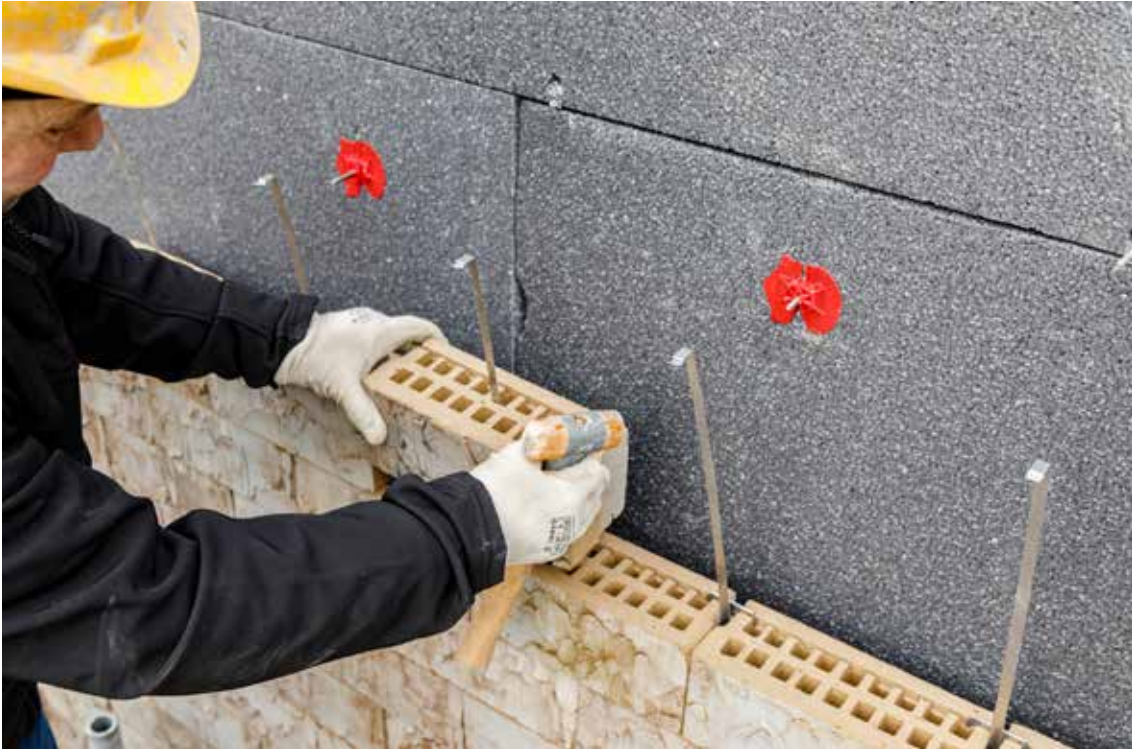
↑ Innovatief circulair bouwsysteem Clickbrick voor het droogstapelen van gevelstenen (ill. Wienerberger)

nogal wat werkzoekenden uit andere sectoren kan aantrekken. De drempel voor het Vlaams Opleidingsverlof werd uiteindelijk, in tegenstelling tot wat AHAD had aangekondigd, niet van 32 naar 16 uur verlaagd.