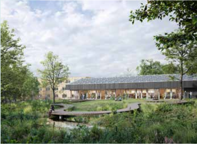
← Nieuwe duurzame campus voor Aquafin op groenblauwe site in Aartselaar (ill. Van Roey)

De VMM kan voor 30 miljoen investeringsprojecten in onbevaarbare waterlopen van 1ste categorie laten uitvoeren. Ook die investeringen hebben tot doel groenblauwe netwerken te creëren en door middel van stuwen en wachtbekkens in tijden van droogte tot een optimaal waterbeheer te komen.