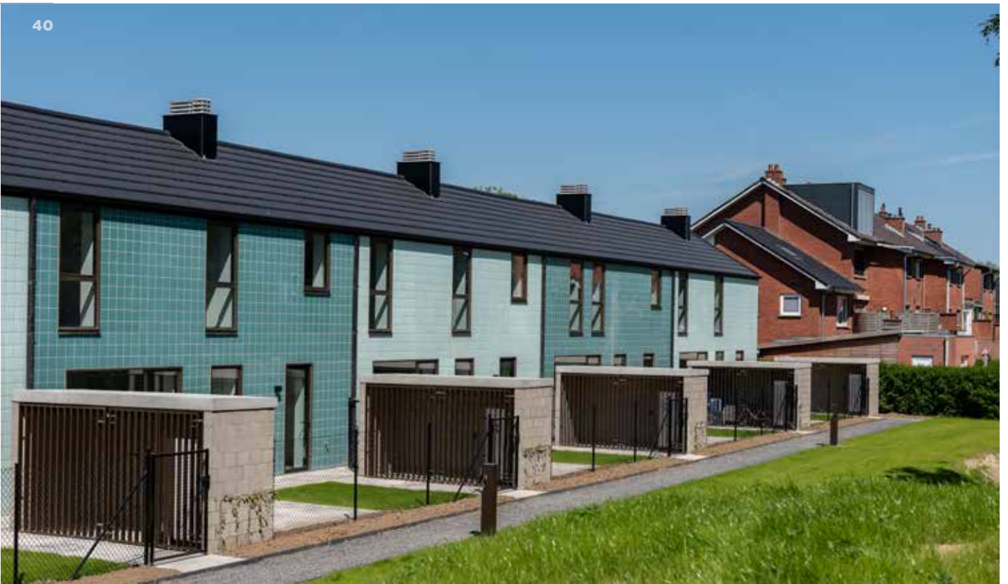
↑ Renovatie van bestaande woningen tot bijna-energie neutrale woningen te Kortrijk (ill. Artes, arch. KRAS architecten)

Bij de regeringsvorming werd al besloten 80 miljoen euro extra in erfgoed te investeren. Daar komt met het Vlaamse relanceplan 100 miljoen euro bovenop. Daarmee wil minister Diependaele de wachtlijst bij de restauratiepremie afbouwen voor gebouwen met een sociale finaliteit (zoals school- en zorggebouwen) en met een culturele finaliteit (zoals musea), voor stedelijke parken en herbestemmingsprojecten die een duurzaam hergebruik van de erfgoed-site beogen, voor kleinschalige projecten die specifieke restauratieknowhow vereisen (zoals orgel- en molenbouw) en voor projecten die bijdragen tot de groene transitie (met aandacht voor bijvoorbeeld de vernieuwing van technische installaties in beschermde gebouwen).