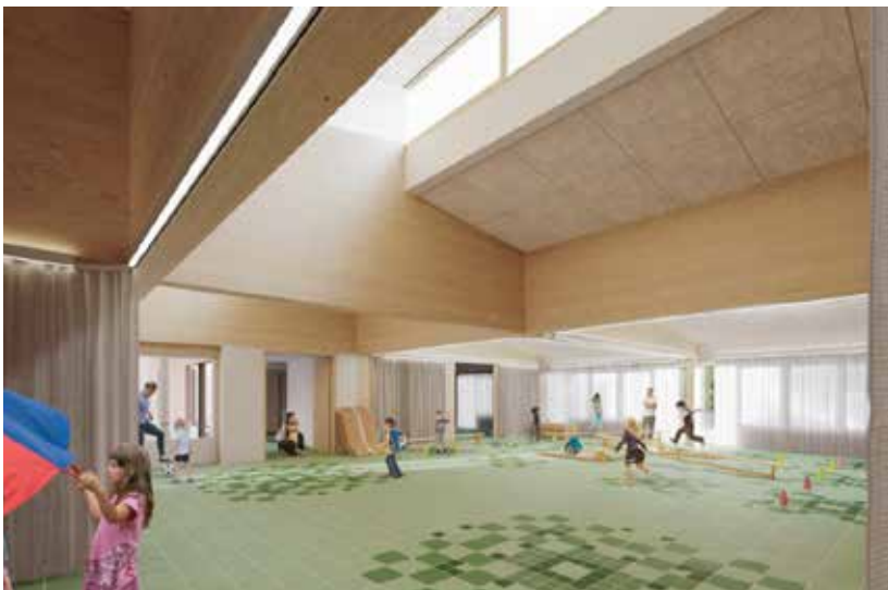
← Via Design & Build gebouwde kleuterschool in Boutersem (ill. VDS Vanderstraeten)

In het kader van het Vlaams herstelplan verwijst de regering ook naar een forse uitbreiding van de steuninstrumenten van PMV (Participatiemaatschappij Vlaanderen) zoals goedkope achtergestelde leningen, PMV/Z-waarborgen, win-winleningen en vriendenaandelen. Ook dit is voor de bouw niet onbelangrijk. Uit het jaarverslag van PMV van 2020 blijkt dat 5% van de PMV/Z-leningen, 6% van de uitstaande waarborgen en 11% van de win-winleningen voor de bouwsector zijn bestemd.