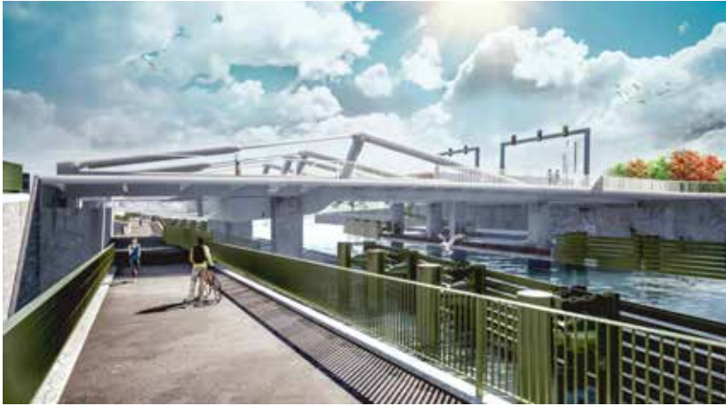
← Nieuwe Meulestedebrug te Gent (ill. agentschap Wegen en Verkeer)

bedoeling is al deze kredieten in 2021 en 2022 vast te leggen. Dat is zelfs sneller dan de Europese Unie eist. Die stelt voorop dat 70% van de door haar goedgekeurde relancesubsidies tegen 2022 moeten en 30% nog in 2023 kunnen worden vastgelegd. De concrete uitvoering van de 885 miljoen extra investeringen zal vooral in 2022 en 2023 plaatsvinden, zoals de evolutie van de vereffeningkredieten aantoont.